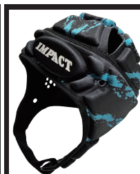
SPLATTER BLACK/PROTEA BLUE