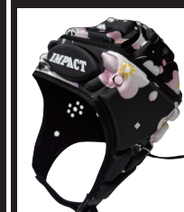
JAPAN FLOWER BLACK