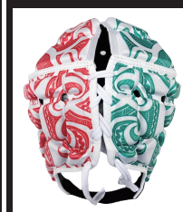
マオリマルチカラー 白×赤×緑