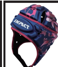
フローラルネイビー