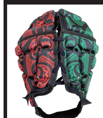
マオリマルチカラー 黒×赤×緑