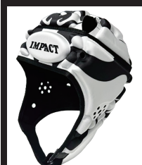
KABUKI REVOLUTION Black