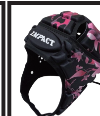
フローラルブラック