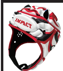
KABUKI REVOLUTION Red