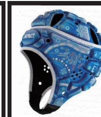
インディジナスブルー