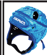
アイランドフラワー ブルー