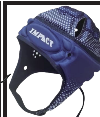
ハーフトーン ネイビー