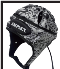
アイランドフラワーグレー