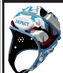
KABUKI REVOLUTION Blue