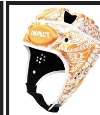
アイランドフラワー オレンジ