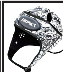
アイランドフラワー ホワイト