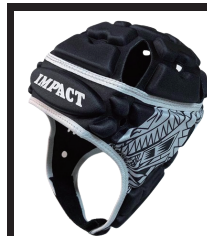
アイランダーブラック