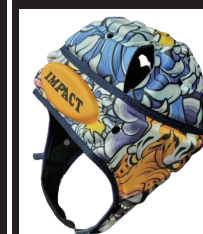
コミックタイガー