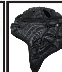
トライブブラック