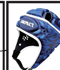
マオリダークブルー