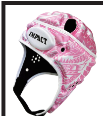
アイランドフラワーピンク