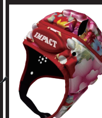
JAPAN FLOWER RED