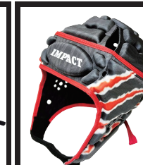
モンスタークロー