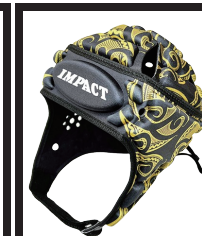
マオリダークゴールド